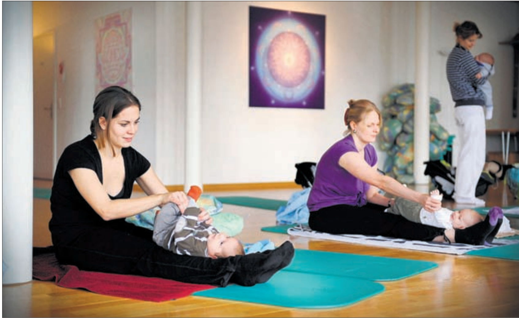
Angebote für Yoga – im Bild Yoga für Babys – sind in der Schweiz immer mehr gefragt.